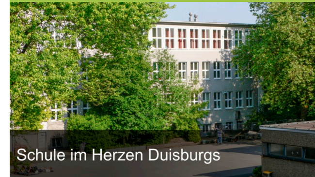
Schule im Herzen Duisburgs

Samstag, 10. Dezember 2022 09:00 – 13:00 Uhr